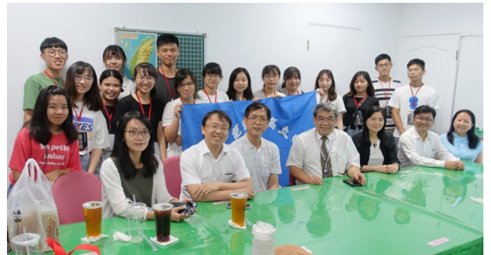
教育部蔡清華政務次長（前排右四）、李毓娟副司長（前排右三）等長官蒞臨內門國中訪視與師資生合照。

109 年 7 月 20 日至 8 月 14 日於高雄市内門國中，由本校 18 名師資生課輔 65 名國一及國二學生，科目包含國文、英文、數學、理化、生物、地理、公民、歷史、體育、美術、音樂、資訊、生活科技、綜合活動、表演藝術、選修課程、團康等，服務時數共 144 小時。7 月 28 日（二）教育部蔡清華次長率同師資培育與藝術教育司李毓娟副司長、廖炯志秘書、陳欣華老師訪視內門國中，參觀師資生教學情形，並與本校師長和師資生、內門國中師長進行互動式對話座談。