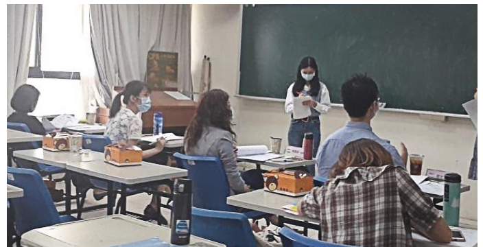
演示者們用心記錄講評的回饋建議