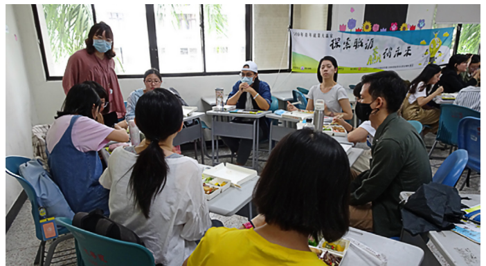
PPSS 人際親和型 小組討論分享