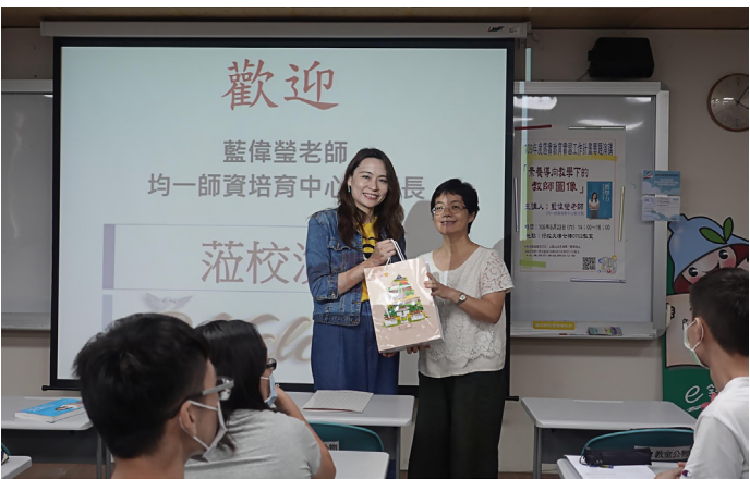
丘愛鈴處長致贈講座紀念品