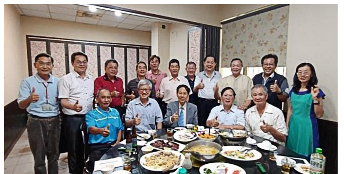
與會人員合影