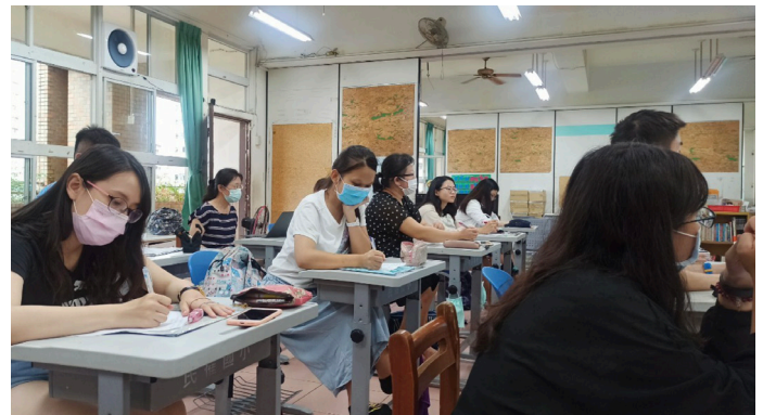
議課後與師資生討論時，師資生專心聆聽與紀錄(圖中條紋衣服為方教授)