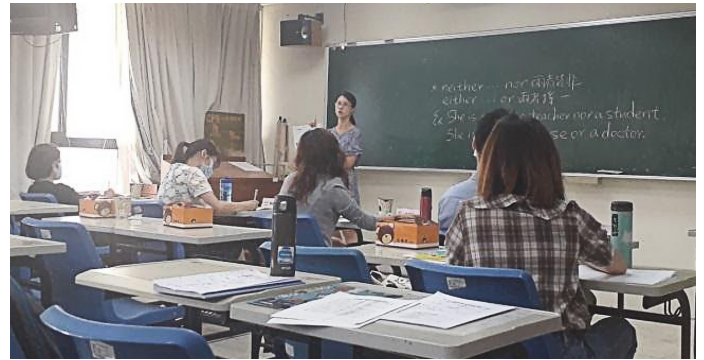
中等教育的試教 - 英文科