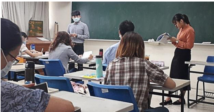
中等教育的試教 - 評審講評