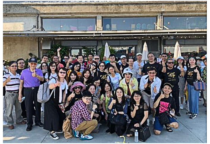
登船出航前大合影