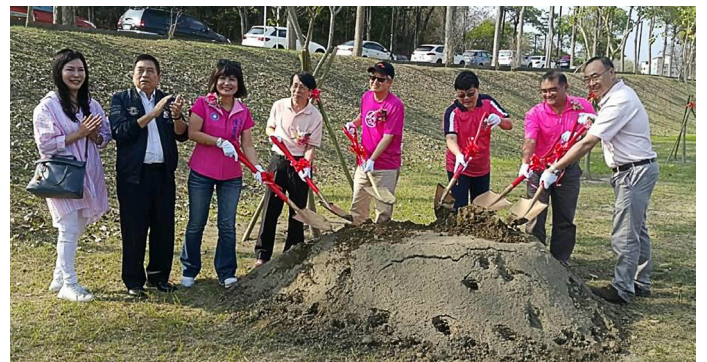
與會貴賓一同持鏟植樹

這次植樹區域選定燕巢校區學生主要生活圈之一的圖資大樓旁園圃，高雄市校友會特別製作立牌並命名「風鈴園」，將 39 位捐樹者留名誌記，期待明年此時重返風鈴園，一同欣賞風鈴木紅花競放的美景。