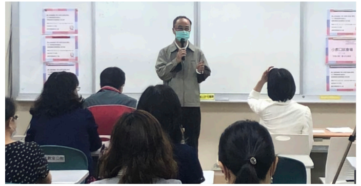
吳教授於開場前給予演示者勉勵