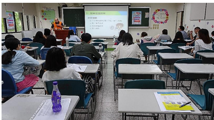
學生專注的聆聽，並認真做筆記