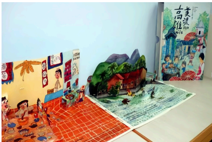
雙語教育學校的當地特色教材。

接著，下午的場次包含論文發表、海報發表與雙語學校發表。在論文發表中，每一場次在主持人、與談人、發表人及與會教師的相互討論中激發了多元豐富的交流；每一場次的發表人均能由教育理論及觀點出發，透過實證研究提供數據與質性資料佐證，為教育現場的實務研究提供精闢見解；海報發表場次也透過多元資料彙整，呈現不同教育面向的詮釋；雙語學校發表的場次更匯聚了各國中小學雙語教育的特色與實務經驗，透過教學演示與觀課模式進行分享，讓與會教師真實體驗雙語教育在課室中落實的成效與遭遇困境。