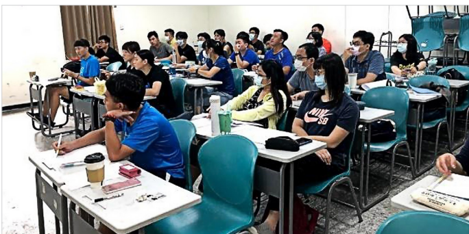
同學們認真的聆聽老師指導重點

110 年起將實施素養導向之教師資格考試，因此出題題目上也將有重大改變。從往年的基本專業知識，近年來多與 12 年國教及素養進行連結。測驗師培生是否具有核心能力及更貼近教育現場，因此题目的方向也較新穎，準備上則須突破好幾個教育觀念，再進行分析答題。每位老師們皆利用自身的專長領域，與大家分享著科目重點，在此更感受到學校對於師培生的關心及祝福。為了增進大家經驗值，師就處對於學校課程規劃及衝刺班更為扎實，期許考生能帶著師長的祝福，勇敢向前，領去教甄之路的入場卷。