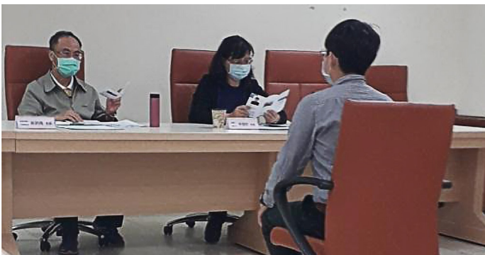
中等教育的口試 - 自我介紹