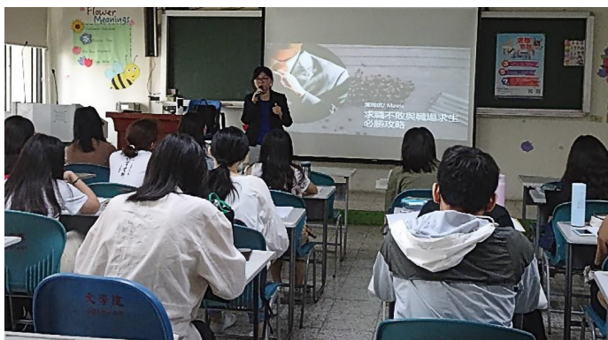
葉瑞琪老師講解履歷撰寫、面試技巧