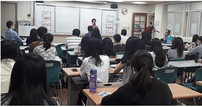
丘處長用金玉良言鼓勵演示者們