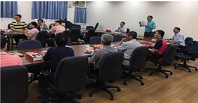
本校南投縣校友會召開第二屆第一次會員大會

本校南投縣校友會於 109 年 6 月 30 日假國立南投高商召開第二屆第一次會員大會，本處校友服務組廖坤鴻組長北上與會，向校友們分享母校發展近況並表達校長對校友會的關懷。何景標理事長逐一介紹與會來賓，並表示非常感謝大家撥冗與會，校友會的順利運作有賴大家同心協力，一起努力，希望未來有更多的校友能一同加入！會議中針對本年度各項年度預算與活動進行討論，會議在熱烈討論聲中畫下完美句點。