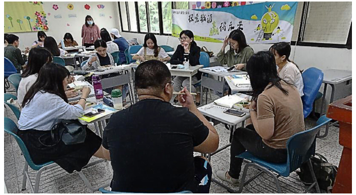
PPSS 領導管理型創意思考型 小組討論分享

透過講師的詳細講解，讓我對於職場面試更深一步的了解，也初步體會到面試的小技巧，如何在眾多應徵者中展現自己的優點，甚至將缺點也轉化成優點。再來透過量表了解自己的特質，講師分析這五項特質可能對應的工作內容，協助我們找尋自己可能適合升任之工作。最後，經由左營就業服務處的人員為我們說明求職的管道、提升能力之三年七萬的在職進修，還有各項政府獎勵金辦法。透過此講座的精心安排與說明，讓即將成為社會新鮮人的我們，更能掌握最新資訊、尋求各種管道自我增能，面對未來職場也比別人更具信心！