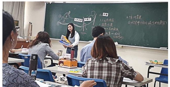
中等教育的試教 - 地理科