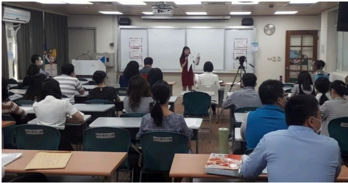
師就處工作人員告知模擬口試和試教地點