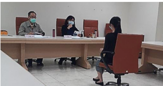
中等教育的口試 - 學歷經驗