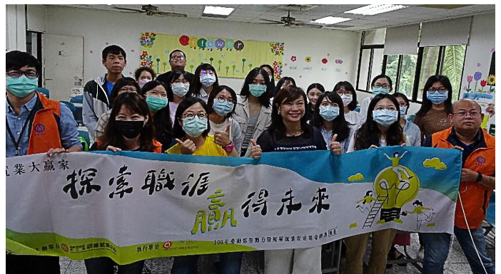
聽完精彩的演講，最後的大合照