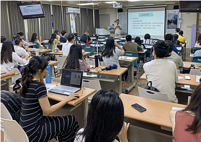
師資生認真聆聽學長經驗談